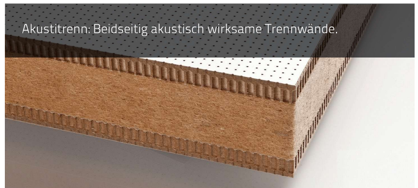
Akustitrenn: Beidseitig akustisch wirksame Trennwände.

Max. Abmessungen: 4000 mm x 1250 mm Randbreiten nach Wunsch